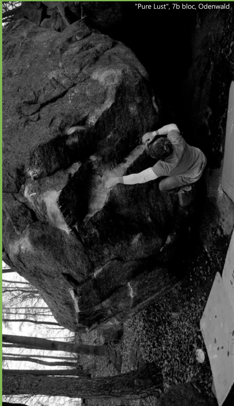
"Pure Lust", 7b bloc, Odenwald

Kletterwände, Griffe, Matten & Kletterkurse